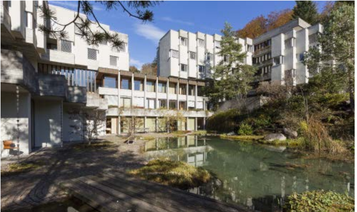
Ein Grossprojekt: Nach der umfangreichen Renovation ist das Lassalle-Haus Bad Schönbrunn für die Zukunft gut gerüstet.