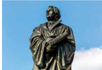
In vielen deutschen Städten erinnern Denkmäler an Martin Luther.