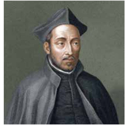
Ignatius von Loyola