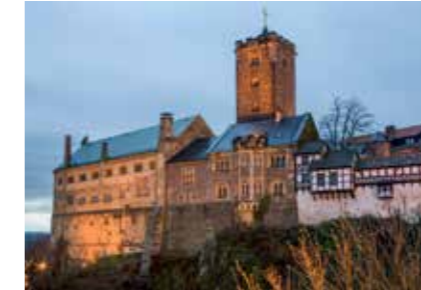
Die Wartburg oberhalb von Eisenach in Thüringen

Besichtigung der Synagoge und der Mikwe in Erfurt. Luther warb zunächst um die Juden und suchte die «Veritas Hebraica». Später wandte er sich scharf gegen Juden und forderte ihre Vertreibung. Ein Blick in die christliche Reformation und ihre negativen Folgen für die Juden. Weiterfahrt nach Eisleben, wo sich Geburts- und Sterbehäuser wie auch die Taufkirche Martin Luthers befinden. Hotelbezug in Eisleben.