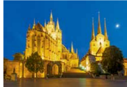
Erfurter Domberg mit Dom (links) und Severikirche

Reisen mit dem Lassalle-Haus sind viel mehr als ein Ausbruch aus dem Bekannten und Gewohnten: Sie öffnen den Blick und das Herz für Religionen und Kulturen; für das Andere, auf den zweiten Blick nicht mehr so Andersartige; für das Fremde, nach der Annäherung gar nicht so Fremde. Im Zentrum aller Reisen stehen Begegnungen. Die Teilnehmenden