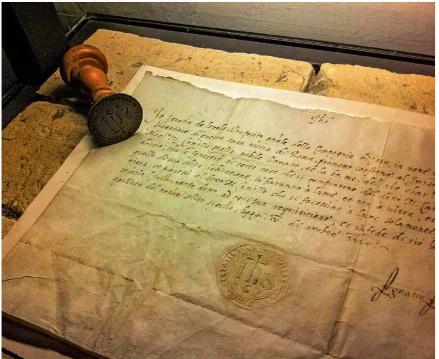
Ein Brief, den Ignatius von Loyola, Gründer des Jesuitenordens, im Oktober 1550 geschrieben hat.