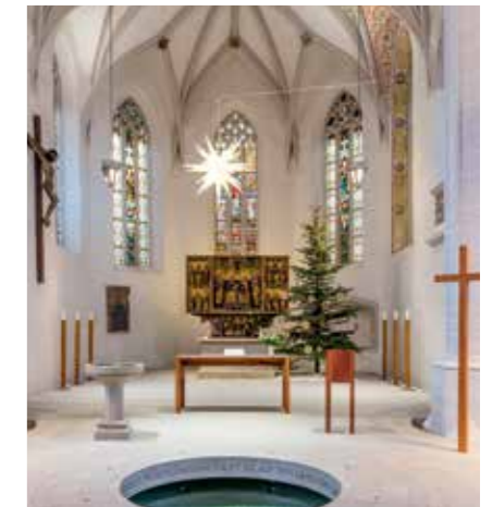
St. Petri-Pauli-Kirche in Martin Luthers Geburtsort Eisleben