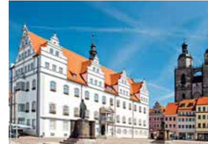
Lutherstadt Wittenberg mit Blick auf den Markt und die Stadtkirche

Besichtigung des Doms von Worms und des Judenfriedhofs – Luther wurde 1521 auf dem Wormser Reichstag wegen seiner vier Reformschriften geächtet. Weiterfahrt über Frankfurt nach Eisenach. Hotelbezug.