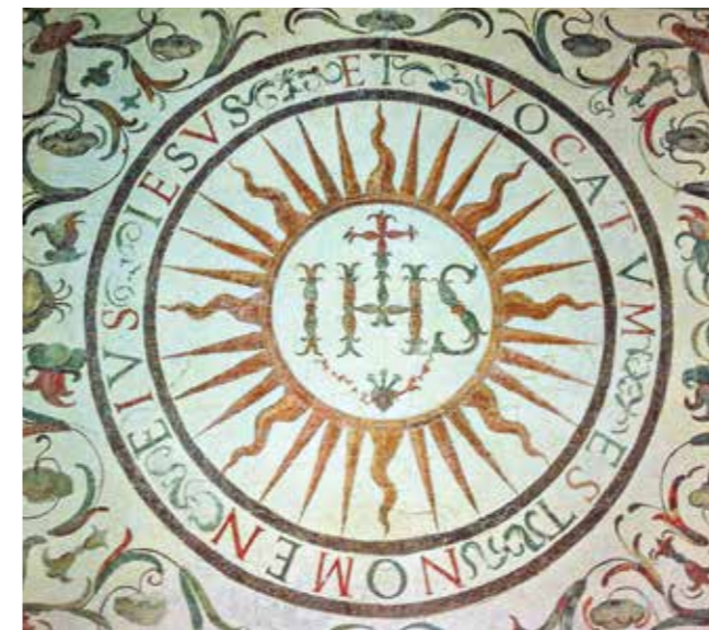
Das Symbol der Gesellschaft Jesu